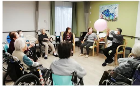
いつも熱戦の風船バレー