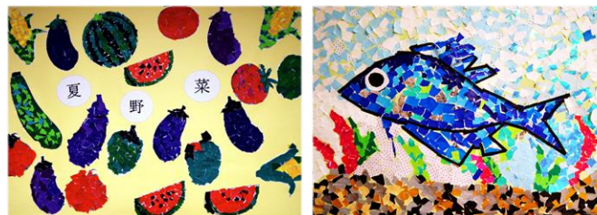
レクリエーションでのご利用者様の制作