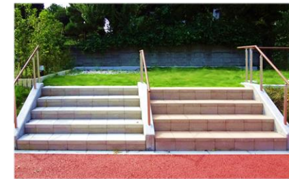
段高さの異なる階段で 昇降トレーニング