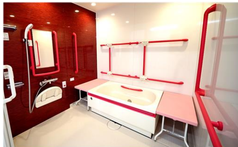
手すりや浴槽位置を動かせる機能的な浴室