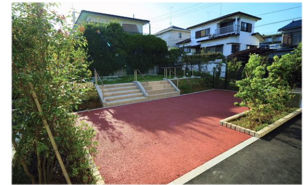
屋外レクリエーション兼トレーニングスペース