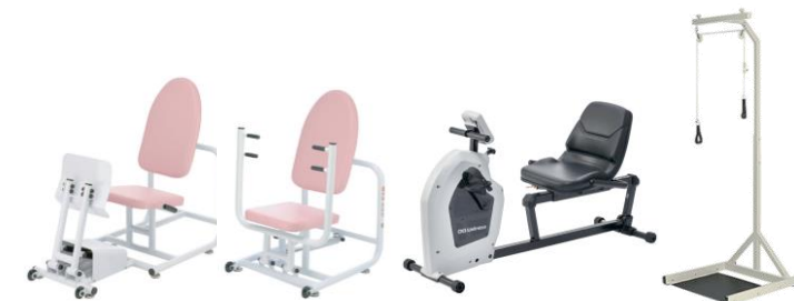
トレーニングマシン