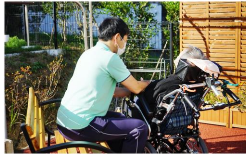
屋外レクスペースでひなたぼっこ