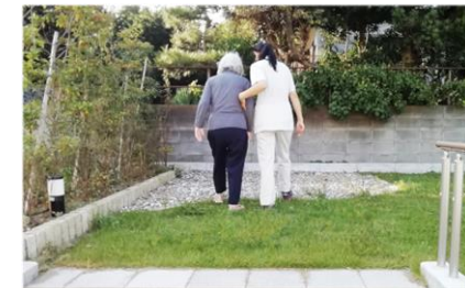
階段上の砂利エリアで 歩行トレーニング